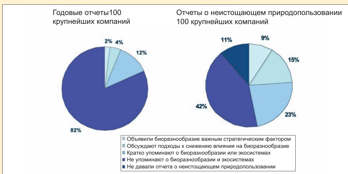
Рисунок 3: Отчетность компаний: биоразнообразию и экосистемам

Еще один обзор, выполненный в 2008-2009 гг. Fauna & Flora International, бразильской школой бизнеса FGV и UNEP Finance Initiative, показал, что большинство компаний в пищевой промышленности, производстве безалкогольных напитков и табачной промышленности публиковали небольшое количество данных по биоразнообразию, редко указывали конкретные цели и полагались на качественные данные (разборы частных случаев, описания инициатив), а не на количественные показатели деятельности 35 . Аналогичное исследование, проведенное британской компанией по управлению активами Insight Investment и сосредоточенное на добывающей промышленности и коммунальных услугах (22 компании в 2004 году 36 и 36 компаний в 2005 году 37 ) дало сходные результаты. Информация о биоразнообразии и эксплуатационных свойствах экосистем, в основном, имеет качественный характер и беспорядочно разбросана по сайтам компаний.