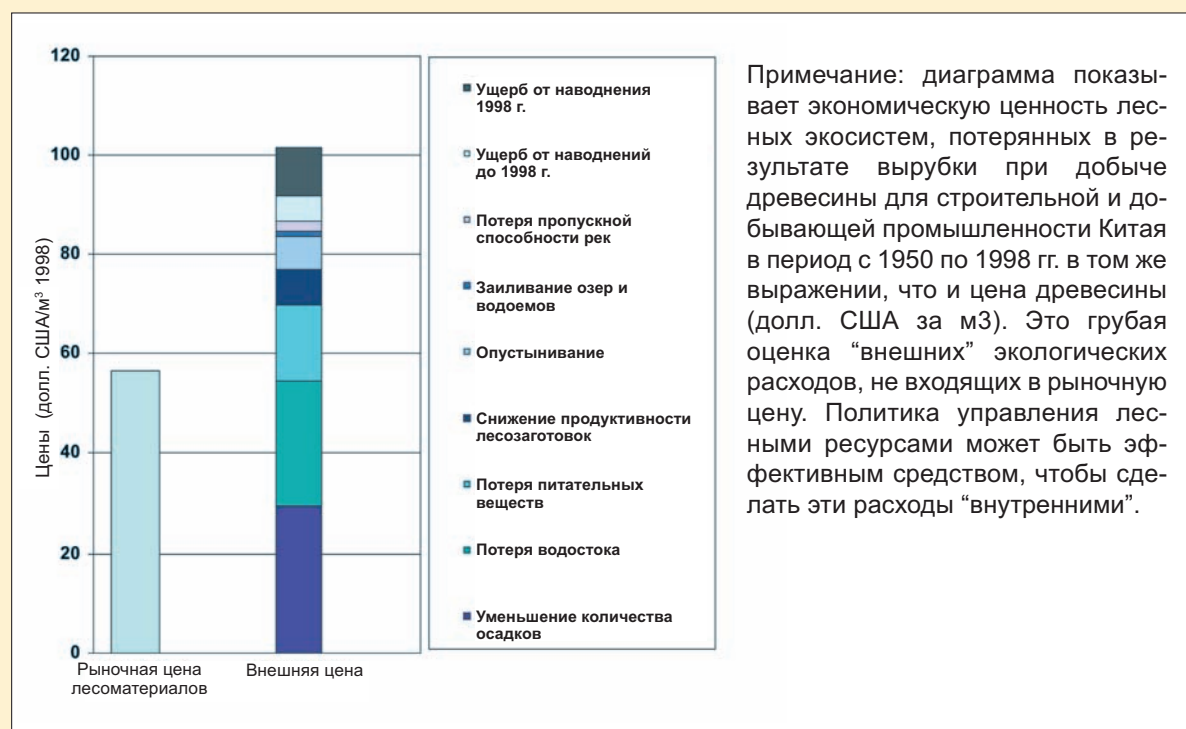
Рисунок 2: Свойства лесной экосистемы и цены на древесину в Китае

Примечание: диаграмма показывает экономическую ценность лесных экосистем, потерянных в результате вырубки при добыче древесины для строительной и добывающей промышленности Китая в период с 1950 по 1998 гг. в том же выражении, что и цена древесины (долл. США за м 3 ). Это грубая оценка «внешних» экологических расходов, не входящих в рыночную цену. Политика управления лесными ресурсами может быть эффективным средством, чтобы сделать эти расходы «внутренними».